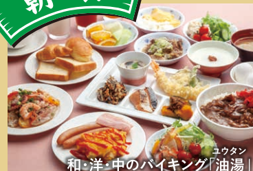
和・洋・中のバイキング「油湯」