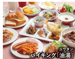
朝食バイキング「油湯」