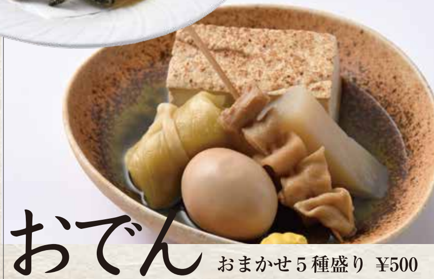
おでん おまかせ5種盛り ¥500